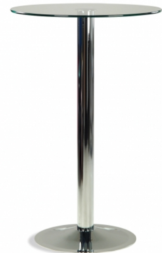
Stehtisch „Fermo 110“