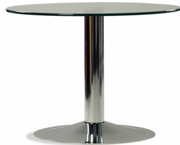
Tisch „Fermo 50“

Die Möbel können beliebig kombiniert werden. Die hier gezeigten Varianten gehören zum modularen System.